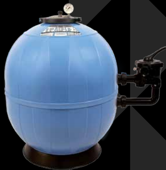
Poseidon™ avec Technologie ClearPro®